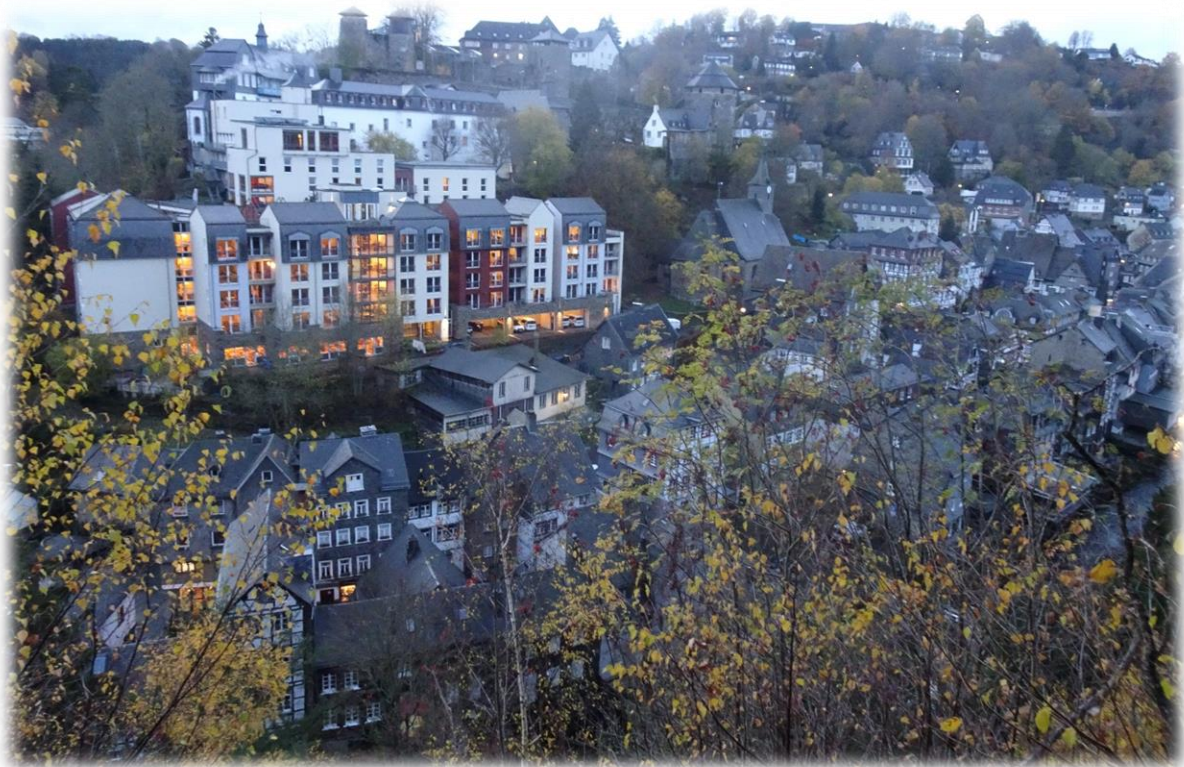
Levendige drukte in oude muren, een middeleeuws stadsbeeld met idyllische vakwerkhuisjes, nauwe steegjes en plaveisel van kinderhoofdjes.