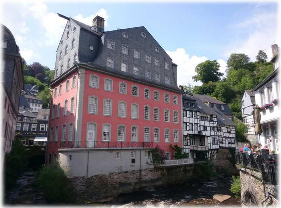
Het rode huis werd rond 1760 door een lakenwever als woon- en handelshuis gebouwd. Wereldberoemd is de hoger dan 3 verdiepingen vrijdragend gebouwde wenteltrap van