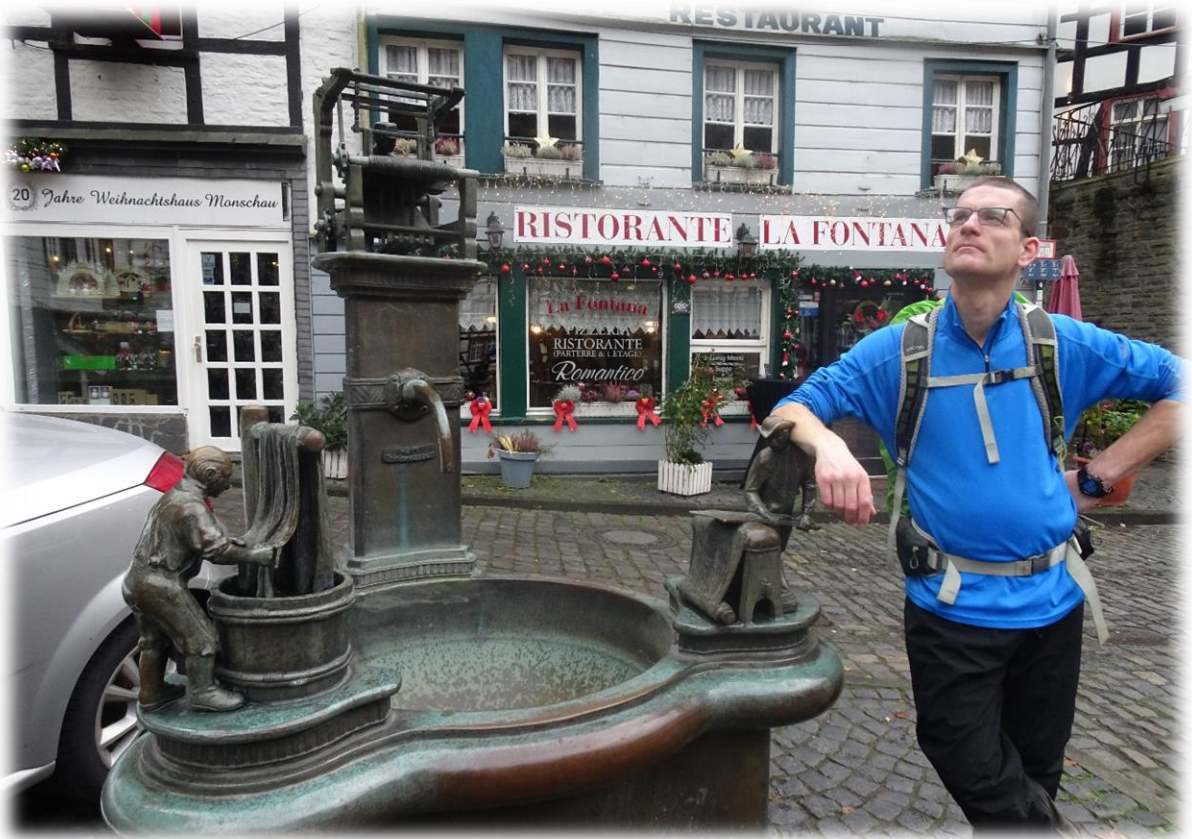
In het centrum van Monschau staat een fontein die herinnert aan de lakenindustrie. Bovenaan zit de wever, links onder hebben we de verver die de lakens een kleurtje geeft en rechts onder hebben we de scheerder die met een grote schaar de rechtopstaande draden knipt.